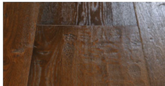
ROVERE PIALLATO FOLLINA